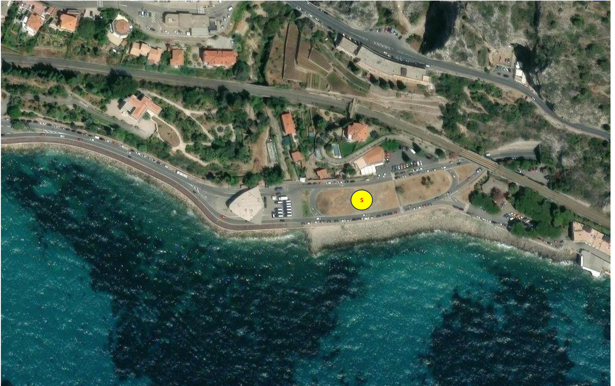
Aiuola n 5 – nella realizzazione in corso delle rotonde nella zona della Frontiera bassa di Ponte San Ludovico, verrà individuata la nuova aiuola che verrà gestita della città di Ventimiglia.