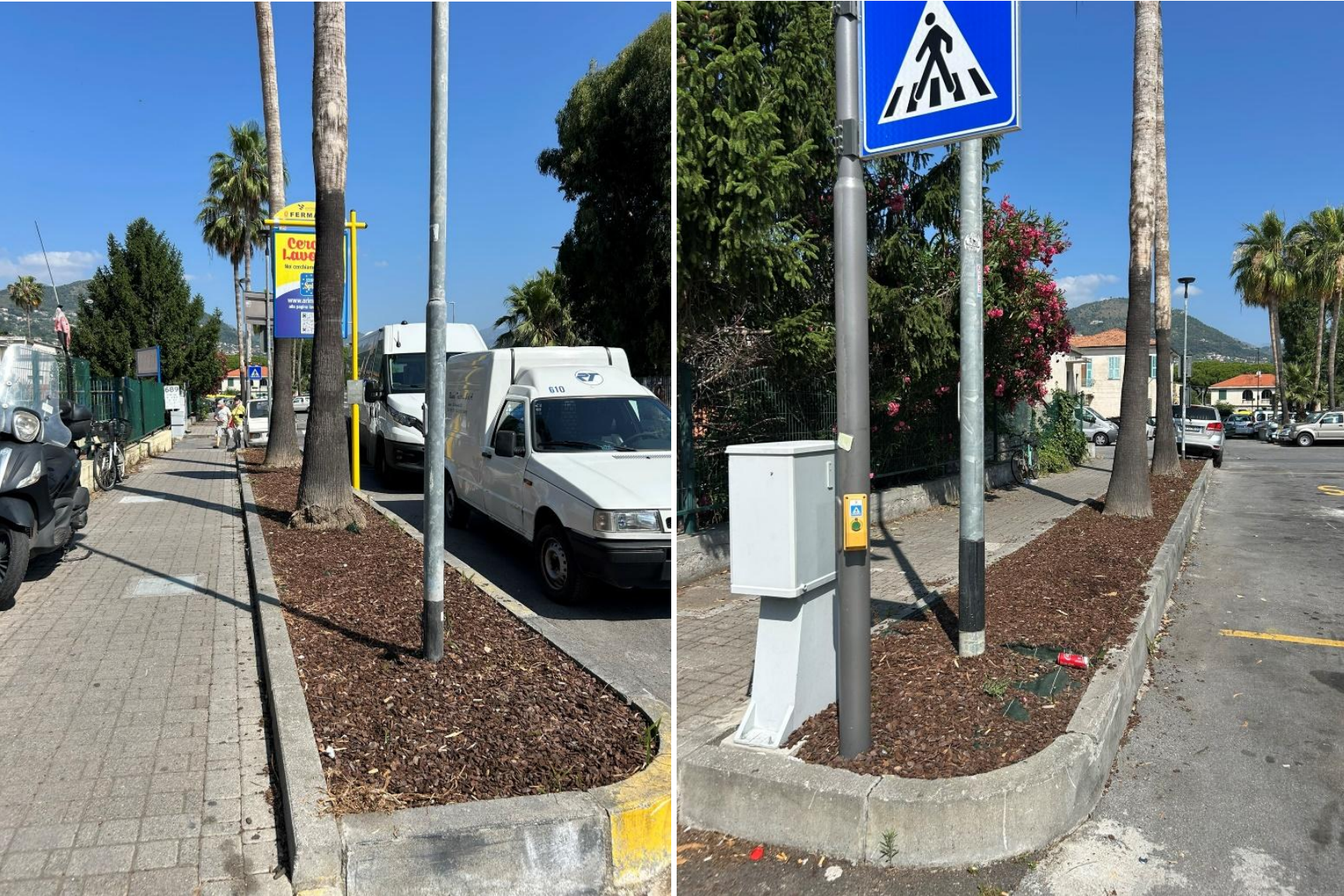
Aiuola n 3A e 3B (due aiuole contigue sulla stessa via) – Corso Francia