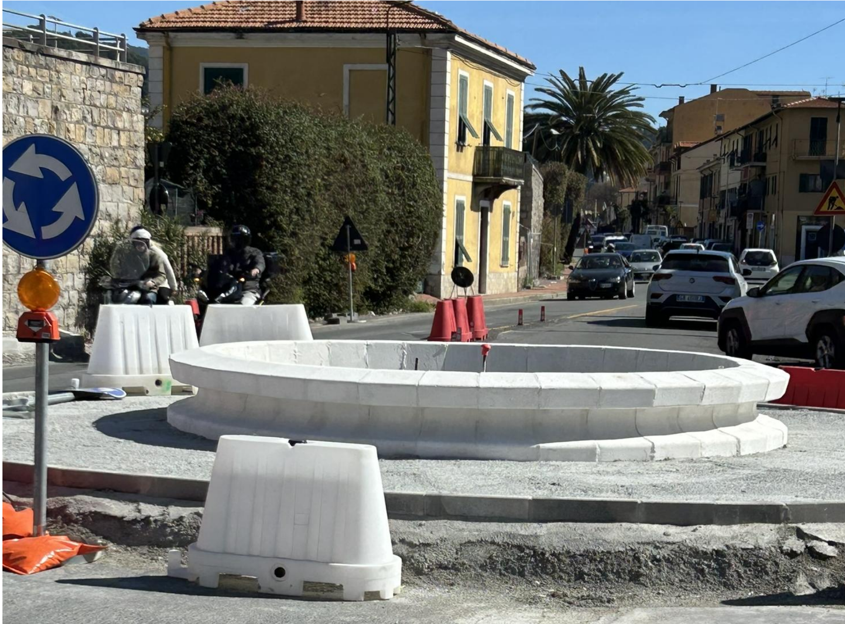
Aiuola n 4A– incrocio tra via Tacito e Corso Genova (lato sud)