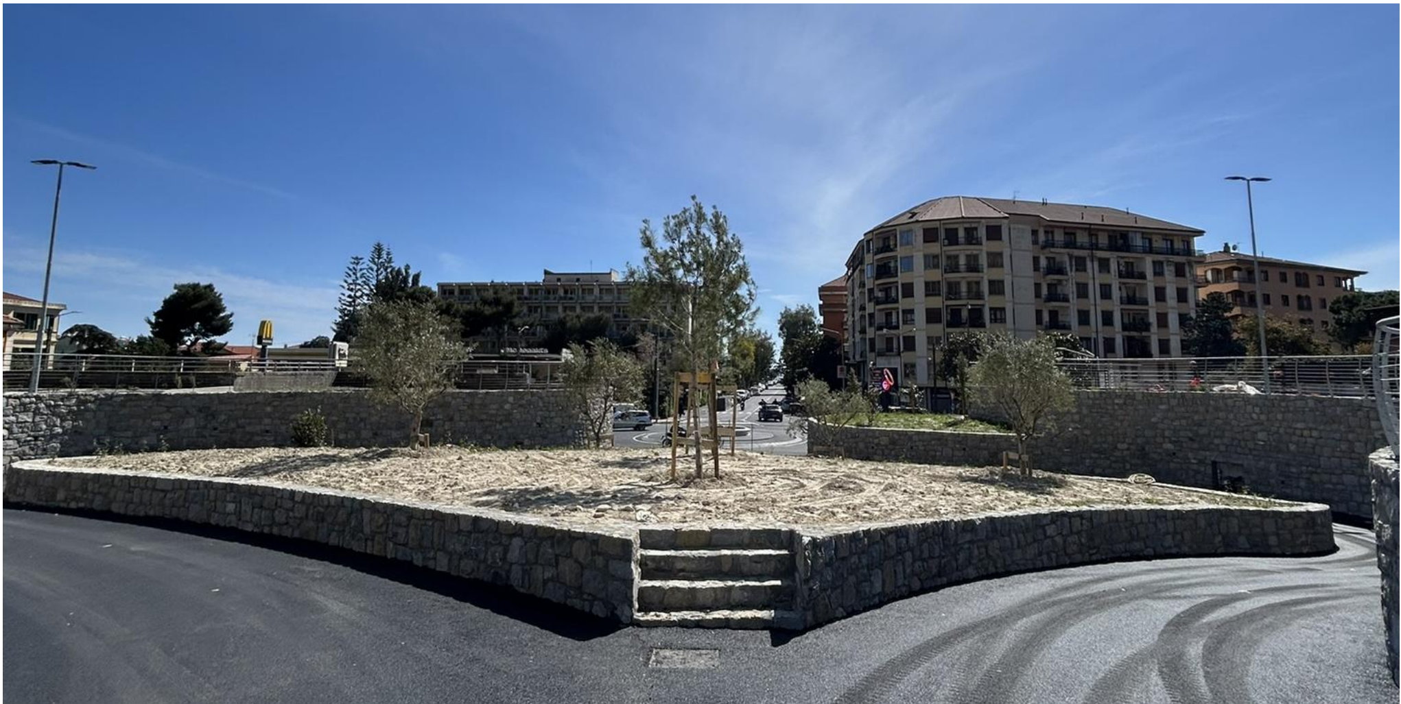
Aiuola n 4B – incrocio tra via Tacito e Corso Genova (lato nord)