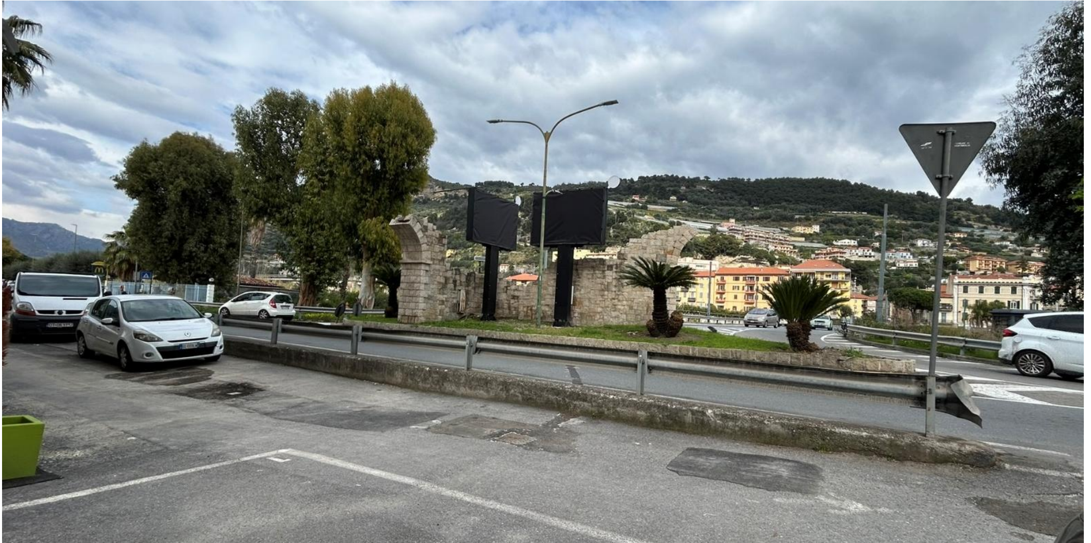
Aiuola n 2B - zona Lago -Corso Francia

Le aiuole 2A, 2B sono da considerarsi un unico lotto