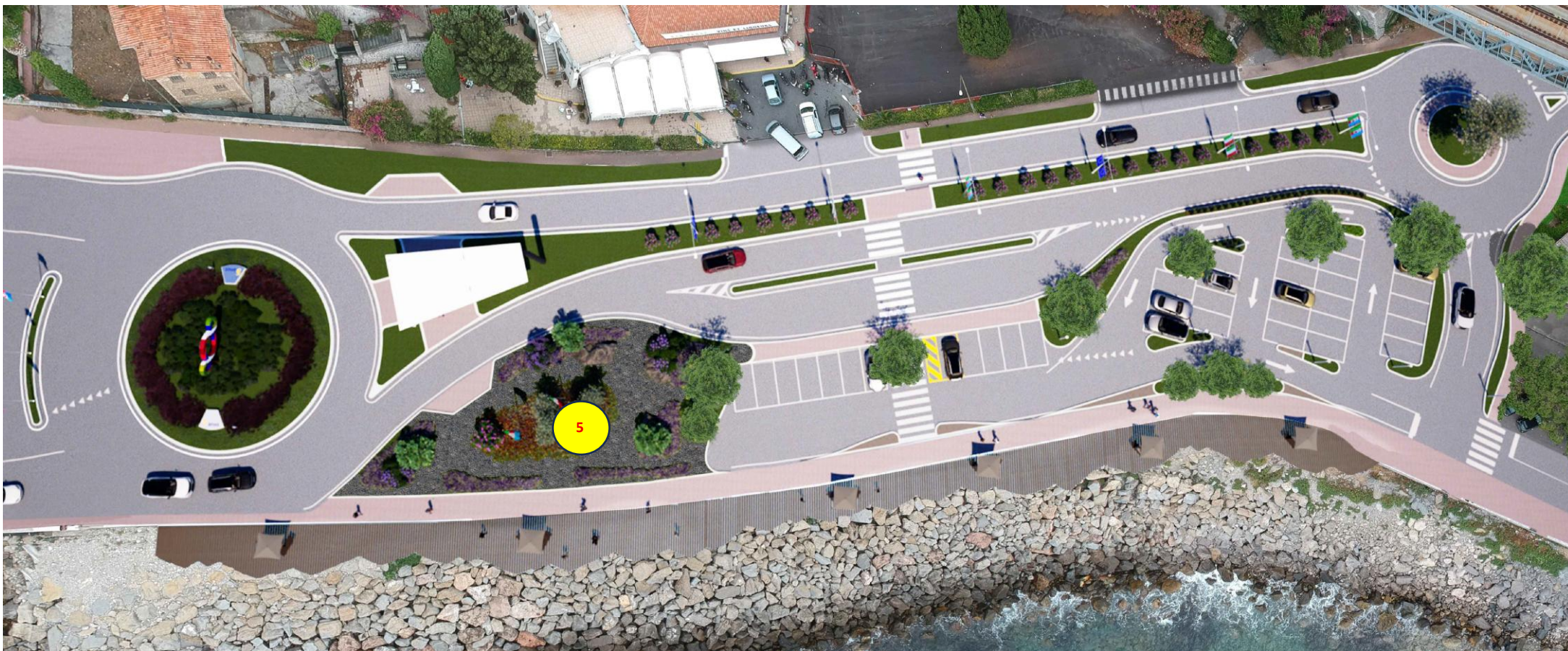
Aiuola n 5 –nella zona della Frontiera bassa di Ponte San Ludovico