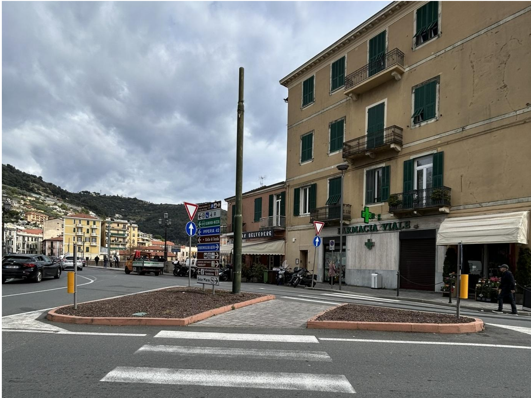
Aiuola n 2A (due aree separate da passaggio pedonale) – Piazza della Costituente