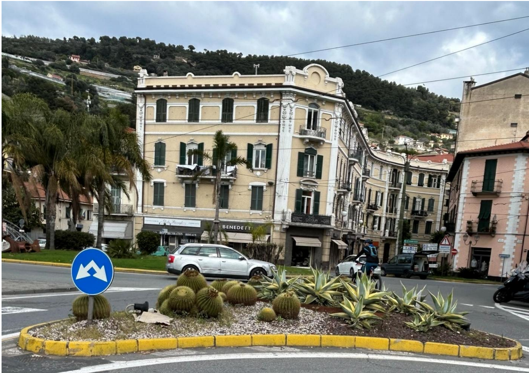
Aiuola n 1 - zona Largo Torino